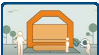
Instructie video: Opbouwen springkussen

Met attractieve groet, Heesbeen Attractieverhuur