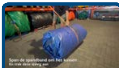
Instructie video: Afbouwen Springkussen