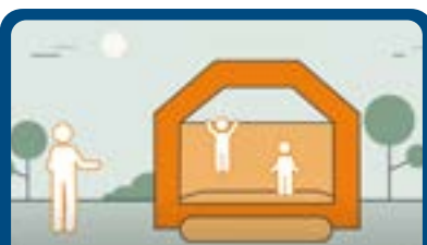
Instructie video: Spelen op een luchtkussen